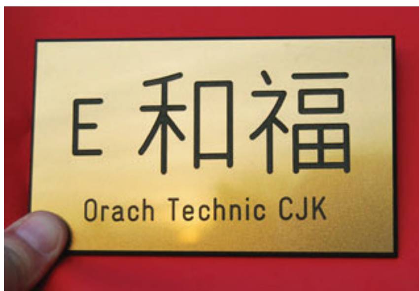
Orach Technic CJK Chinese - Engraved plate